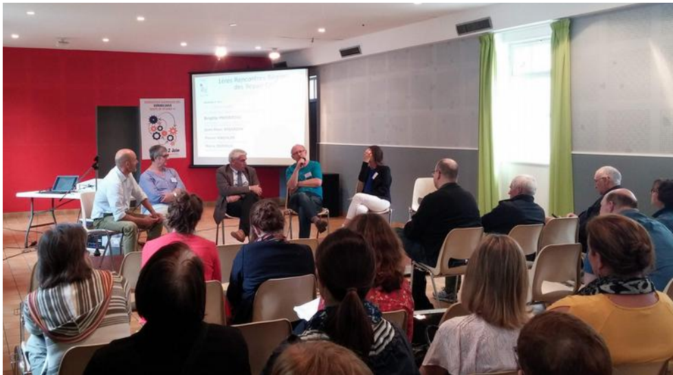
Table-ronde sur « la place des Repair Cafés dans la réduction des déchets »