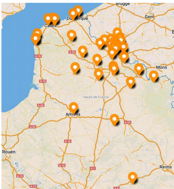
Repair Cafés HdF au 1 er juin 2018 (liste en annexes)

En juin 2018, il existe en Hauts-de-France une quarantaine de Repair Cafés , qui œuvrent individuellement dans la lutte pour la réduction des déchets. Chacun dans leur coin, ils s'organisent, se développent, et mettent en place les outils de leur propre succès. Pourquoi ne pas réfléchir à un moyen d'unir ces forces, de mutualiser les compétences et les ressources, et de trouver un moyen de faire réseau ?