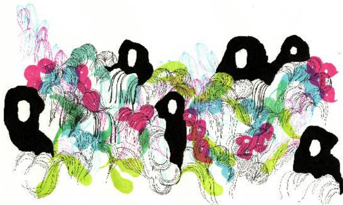
Honky Ponky, Qubo gas 2009 Encres et feutres sur papier